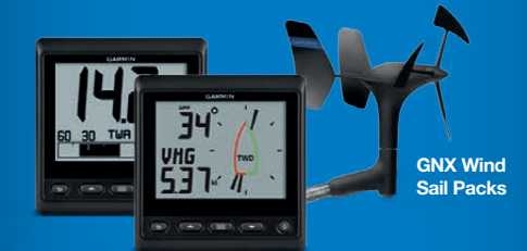
GNX Wind Sail Packs