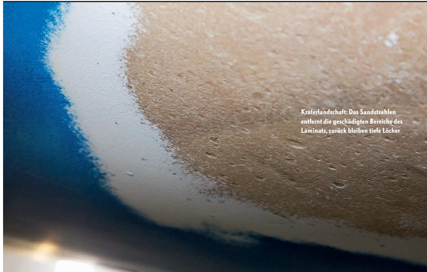
Kraterlandschaft: Das Sandstrahlen entfernt die geschädigten Bereiche des Laminats, zurück bleiben tiefe Löcher